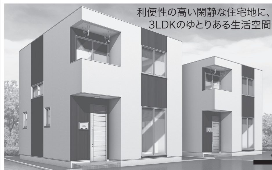
利便性の高い閑静な住宅地に、 3LDKのゆとりある生活空間

「TOPシステム」からの新提案 土地活用のための貸家であったり、夢のマイホームであったり...それが「TOP House」