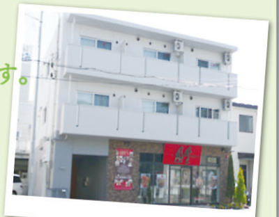
◀店舗+マンション(八戸市内)▶

所有している土地の周辺環境によっては 合理的な活用が可能です。店舗やマンショ ンなど、お持ちの土地を田名部組と一緒に 考え直してみませんか?